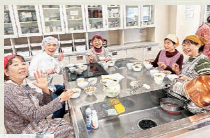
今年の調理の様子

しかし、減塩と聞くと「全ての食事が薄味、味気の無いものになり、食事を楽しむことができなくなる」と思われがちです。今回は協同病院の調理師が「おいしく減塩」を考えたすこしおレシピを紹介します。