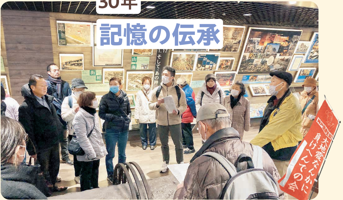
1/17 (金) 阪神淡路大震災をふりかえる長田メモリアルのつどいを開催しました。