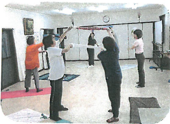
ロコモ予防体操はじめませんか?